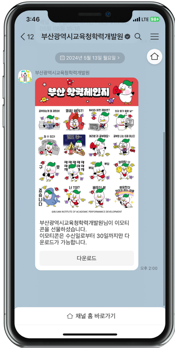
이해를 돕기 위한 예시 화면

사용자가 브랜드 카카오톡 채널에서 해당 채널 추가 즉시 이모티콘이 지급됩니다